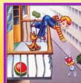
Не играй на балконе, упадешь