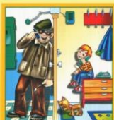
Не разговаривай и не открывай дверь незнакомым людям