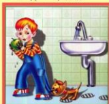
Мойте руки перед едой