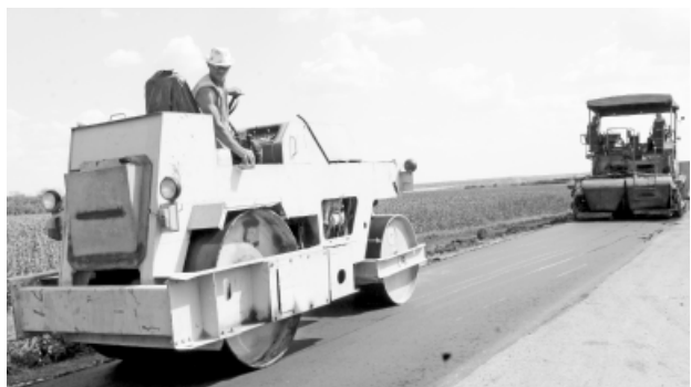
Ремонт дороги на село Свищёвка